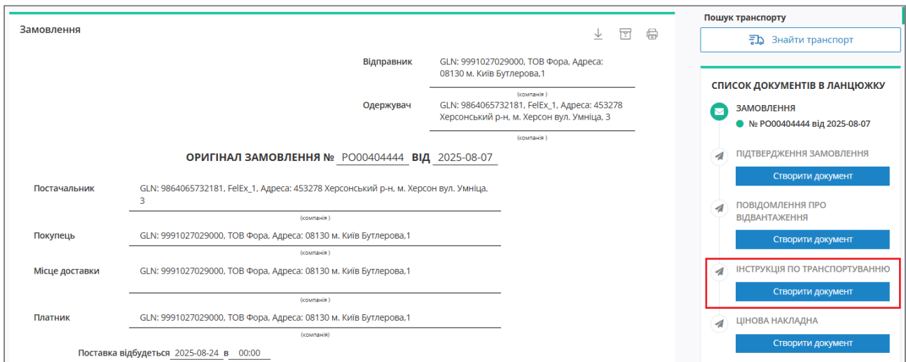
Зображення 4 - Створення Інструкції про транспортування

2. Відкрийте потрібне Замовлення (ORDERS) та створіть Інструкцію про транспортування (IFTMIN) в блоці ланцюжка документів за допомогою кнопки « Створити документ » (Зображення 4).