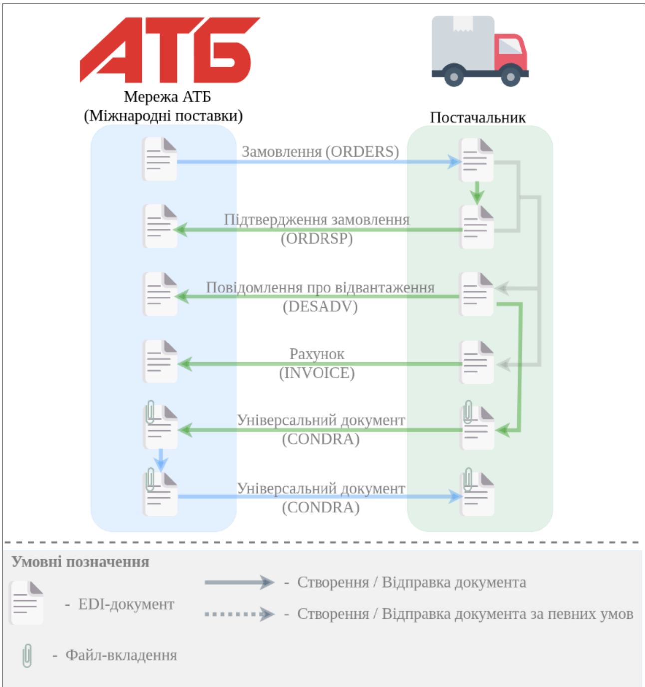
Зображення 1 - Загальна схема документообігу для міжнародних поставок з мережею АТБ

На схемі відображено послідовність обміну електронними документами між мережею АТБ та постачальником у межах процесу міжнародних поставок. Документообіг передбачає передачу замовлення, підтвердження замовлення, повідомлення про відвантаження, рахунку та універсального документа.